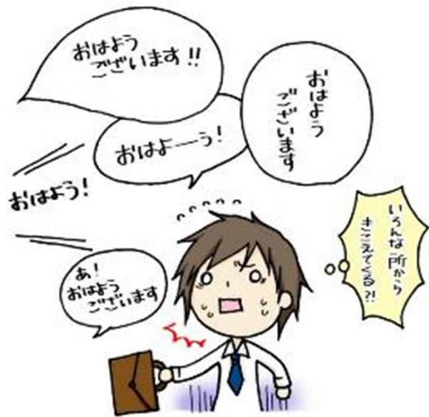
監修・文 水野敦之 絵：宗貞由貴子