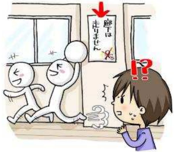
監修・文 水野敦之 絵：宗貞由貴子