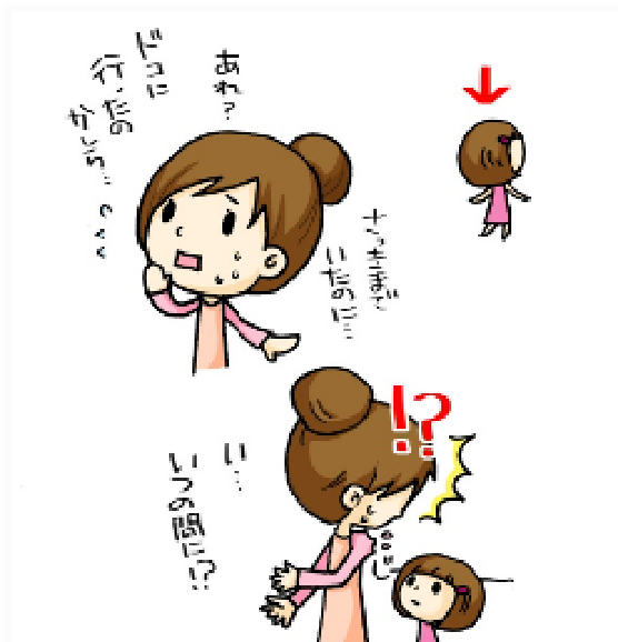
監修・文 水野敦之 絵：宗貞由貴子