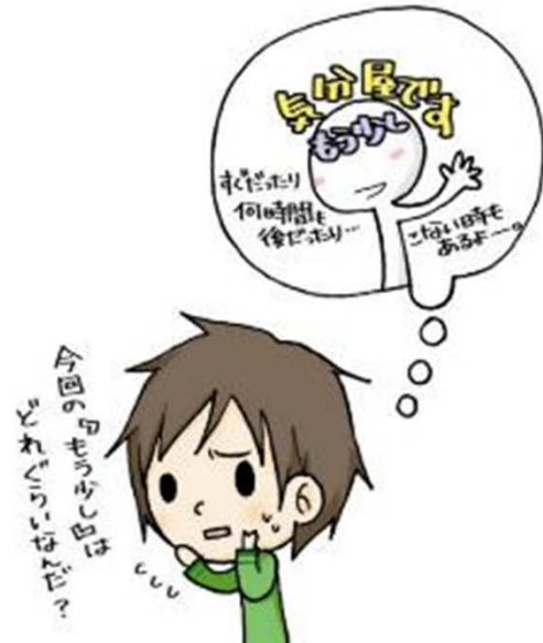
監修・文 水野敦之 絵：宗貞由貴子