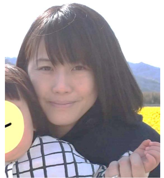
一般社団法人 未来図 代表

幼児期に関係のある方だけではなく、学齢期や成人期の支援者にもたくさんのヒントがあると思います。是非、ご参加ください。